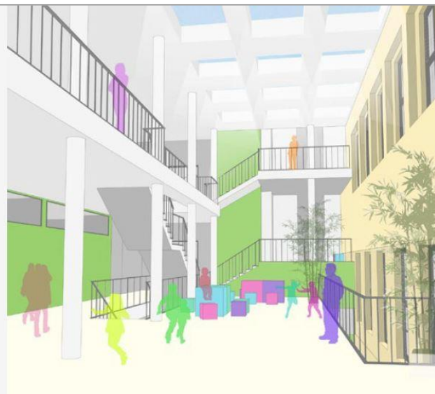
Entwurf: GSD – Gesellschaft für Stadt- und Dorferneuerung